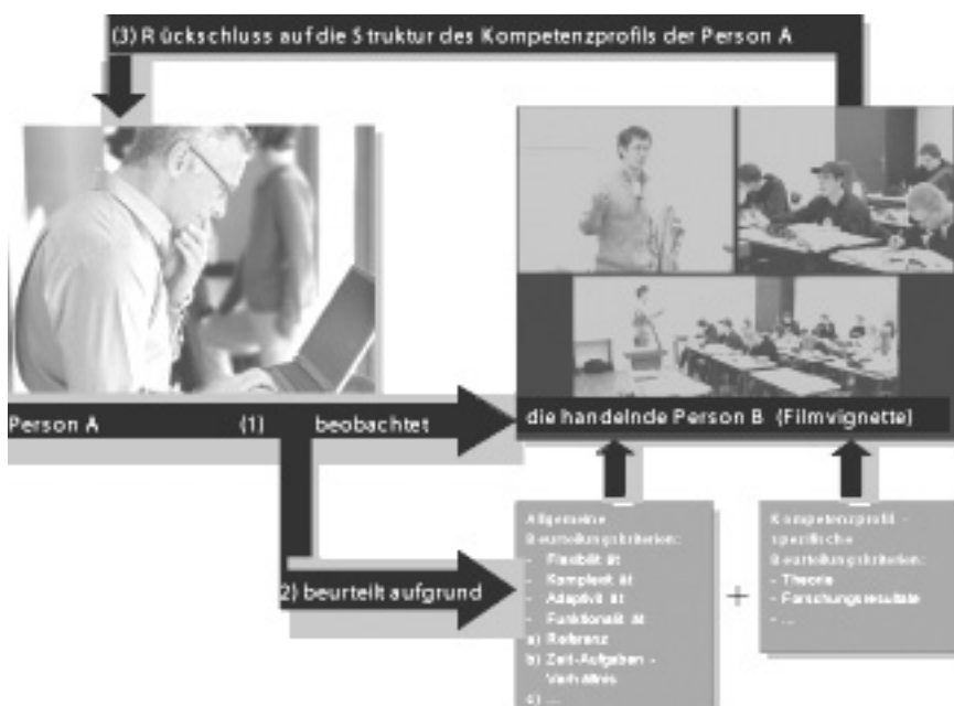
Abbildung 1: Beobachtungs- und Beurteilungsprozess zur Erfassung von Kompetenzprofilen

Über die Beobachtung und Beurteilung des Verhaltens dieser Drittlehrperson soll der Zugang zur Struktur des Kompetenzprofils der beobachtenden Person ermöglicht werden. Die Abbildung 1 zeigt, dass die Person A das gefilmte Unterrichtsverhalten der Person B in Bezug auf einen definierten Standard (1) beobachtet. In einem zweiten Schritt wird die Person A gebeten, das beobachtete Lehrerverhalten der Person B anhand bestimmter allgemeiner und kompetenzspezifischer Kriterien zu beurteilen (2). Durch diese systematische, nach Kompetenzprofilen getrennte und theoriegeleitete Beurteilung werden Rückschlüsse auf die Struktur des beurteilten Kompetenzprofils der Person A möglich (3). Wir nehmen also an, dass die Beurteilung eines bestimmten Kompetenzprofils bestimmte kognitive Strukturen voraussetzt, die sich abhängig vom Grad der Expertise qualitativ unterscheiden. Dies heisst also, dass Experten bzw. professionell Handelnde ähnliche Strukturen aufweisen, die eindeutig von jenen der Nicht-Lehrpersonen und Novizen unterschieden werden können. Selbstverständlich kann aufgrund dieser Beurteilung der Lehrperson A nicht vorausgesagt werden, ob sie in einer ähnlichen Unterrichtssituation besser, weniger gut oder in Übereinstimmung mit ihrer Beurteilung konsistent handelt.